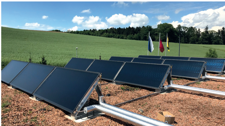
Thermische Solaranlage, die perfekte Ergänzung zu einer Holzschnitzel-Wärmeerzeugung (realisiert für eine Schulhausanlage gemäss Wärmeerzeugungskonzept).

Wasser ist ein elementares und oft zentral gesetztes Thema der Bitzer Sanitär AG. Ganz nach dem Credo «Wasser, unser wichtigstes und wertvollstes Lebensmittel». Durch die Corona-Krise wurden viele Trinkwasser-Installationen ausser Betrieb genommen (Hotels, Restaurants usw.). Aufgrund des «toten Wassers», besteht bei