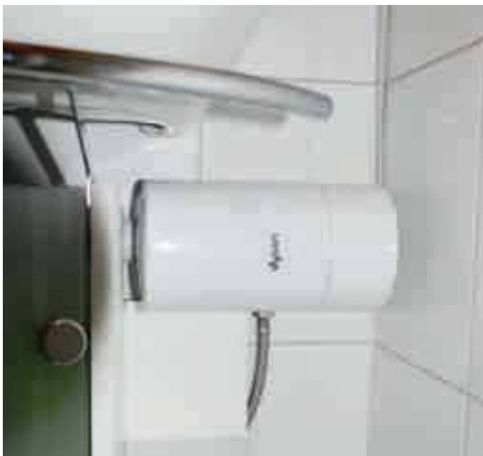
Der Motorblock darf nicht kopfüber und oberhalb des Waschbeckens installiert werden.

torblock darf nicht kopfüber und oberhalb des Waschbeckens installiert werden. Am Gehäuse ist alles ziemlich eng, es hat schon einiges an Zeit gebraucht, bis alle Schläuche zusammengesteckt waren – die Gehäusedemontage