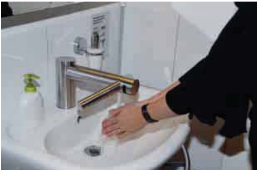
Mit dem Dyson Airblade Tap geht's einfach: Waschen...

Wichtig beim Airblade Tap von Dyson ist, dass am Anfang alles genau durchdacht wird, bevor die Arbeit losgeht. Zu berücksichtigen ist auch, die Installation der Elektrik früh genug zu koordinieren. Die Abklärungen der elektrischen Leitungen gehen bei solchen Installationen gerne vergessen. Es wird empfohlen, einen Mischer zu installieren, damit eine konstante, angenehme Temperatur des Wassers gewährleistet werden kann.